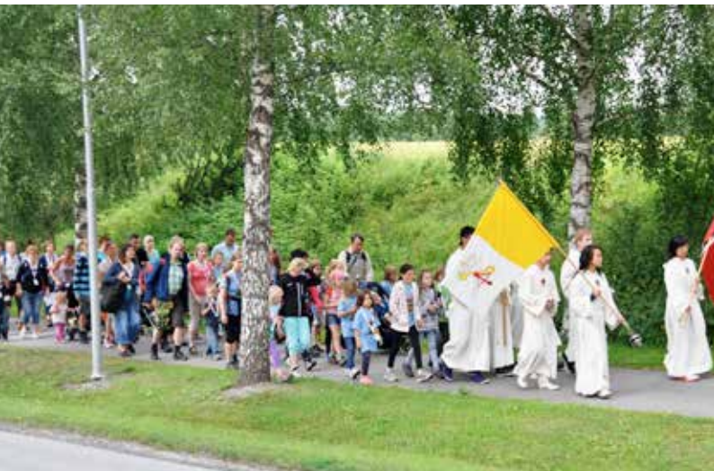
Olsokprosesjon til Stiklestad gamle kirke.