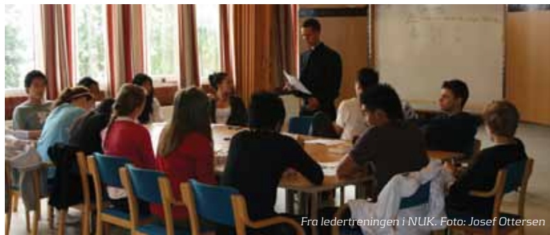
Fra ledertreningen i NUK.