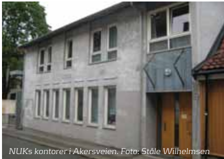
NUKs kontorer i Akersveien.

informasjonspakker om NUKs arrangementer og tilbud som sendes til lokallag og menigheter, bestilling av leir- og kurssted og transport for NUKs arrangementer, redigering av årsrapport, utsending av materiell til adventsaksjonen, sending av bladenes ferdige layout til trykkeri, og mye mer.