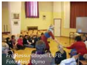
Fra Ressursdagen OULFB.

det lokale barne- og ungdomsarbeidet. Vi har en bred målgruppe, og ønsker å støtte og bidra til alt som kryper og går av barne- og ungdomsaktiviteter i det ganske land, det være seg katekese, barnegrupper eller ungdomslag. Ressursgruppen har vært et dynamisk utvalg i NUK, hvis ønske har vært å reise rundt til ungdommer og lokalag som har trengt litt hjelp, eller bare et hyggelig besøk.