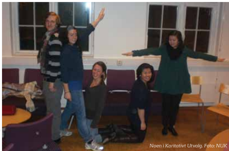
Noen i Karitativt Utvalg.