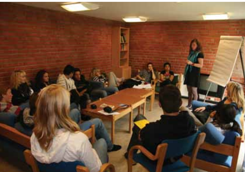
Fra Høstsamlingen 2008.