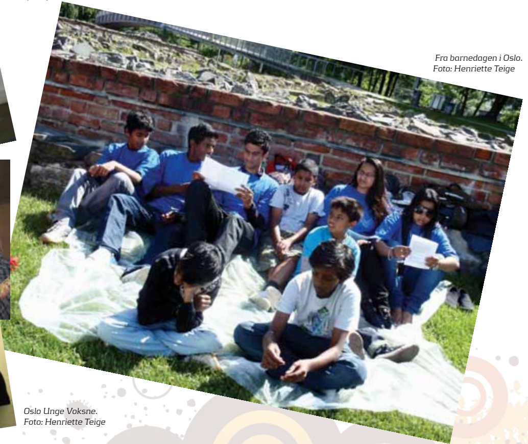
Fra barnedagen i Oslo.