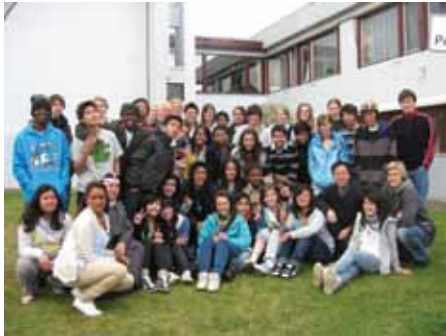
Konfhelg i Levanger - mai 2008.

norske og internasjonale studenter og unge voksne, noe som gjør at de for det meste snakker engelsk under møtene sine.