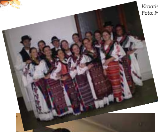
Kroatisk Ungdomslag feirer St Nikolaus.