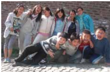
Fra Distrikt Sør.

Spesielt gledelig er det at St. Peter menighet i Halden har fått et nytt ungdomslag og en ny unge voksne-gruppe som er forsøt startet i Fredrikstad.