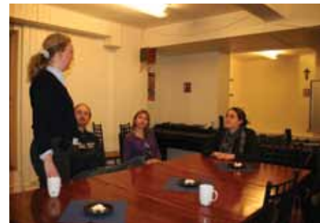
Fra Oslo Unge Voksne.

I tillegg til de lokallagspesifikke møtene har det vært arrangert juleball og adventsak-sjon fra distriktets side (definitivt det største arrangementet med flere stands i Oslo), levende musikk og overnatting for de som ønsket det, og innsamling og vafler på Youngstorget en kald vinterdag. På St. Olav