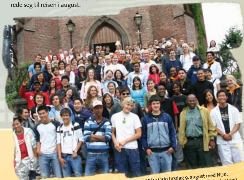
Alle deltakere som reiste til Verdensungdomsdagene 2005 fra Oslo tirsdag 9. august med NUK. Sammen med gruppene fra Kristiansand og Stavanger ble antallet norske deltakere på Verdensungdomsdagene 2005 over 200!!!

Aldri før har så mange pilegrimer fra Norge reist til Verdensungdomsdagene. Aldri før har det vært så viktig å følge opp ungdommen etter et slikt arrangement. Dette arbeidet er allerede i gang, og får helt klart minst ett avsnitt i årsrapporten for 2006 :).