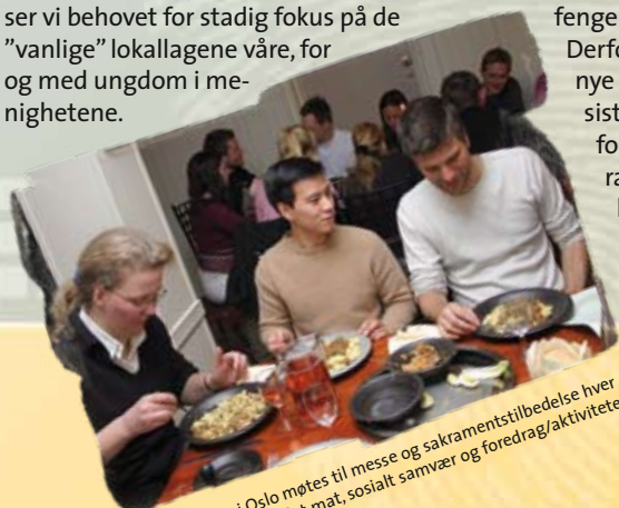
Unge Voksne i Oslo møtes til messe og sakramentstilbedelse hver onsdag. Etterpå er det mat, sosialt samvær og foredrag/aktiviteter om katolske emner.

Det er også stadig en utfordring å bidra til at de årlige konfirmantkullene i våre menigheter forblir aktive ungdommer i Kirken. Her kan ungdoms engasjement i tilknytning til konfirmantkatekesen være av avgjørende betydning. Vi som unge mennesker, er kanskje bedre stilt enn noen andre, til å kunne bære vitnesbyrd om Evangeliet, for dem som er yngre enn oss. Dette er en utfordring for kateketene og for prestene, men også for oss som driver med ungdomsarbeid. Ta utfordringen!