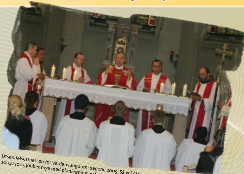
Utsendelsesmessen for Verdensungdomsdagene 2005: Så vel AUV som NUKs sekretariat har i perioden 2004/2005 jobbet mye med planlegging av turen til Verdensungdomsdagene i Tyskland.

Det har vært en stor ære å jobbe med en så engasjert og ivrig gjeng som det dette AUV har vært! La oss håpe og be om at deres arbeid vil bære frukter og inspirere andre til å arbeide for kirken i Norge.