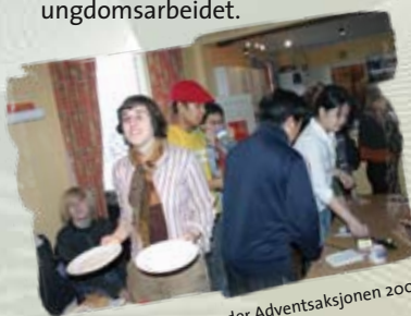
Lokallaget i Tønsberg under Adventsaksjonen 2004.

Trenden i perioden 2004/2005 er fortsatt at flere menigheter har ungdomsgrupper som jevnlig møtes. Ofte er prestene i menighetene involvert i dette arbeidet. Deres innsats er uvurderlig for unge katolikker over hele landet! I noen menigheter er det også andre voksne eller eldre ungdommer (i 20 årene), som bidrar sterkt til ungdomsarbeidet blant yngre ungdom. Det er svært mye som tyder på at samarbeid mellom prest, voksne/eldre ungdom og ungdommer på 16-18 år, som aktivt tar ansvar for ungdomsarbeidet, gir gode frukter i ungdomsarbeidet.