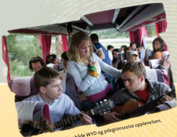
Busreisen er en del av både WYD og pilegrimsreise opplevelsen.