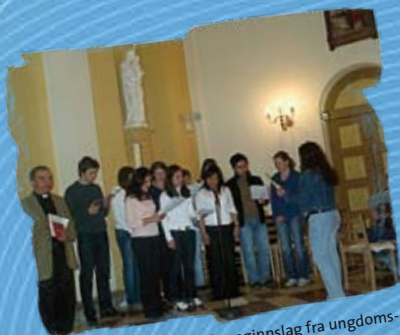
Distrikt Vest: Messe med sanginnslag fra ungdomsgruppen i St Paul i Bergen.