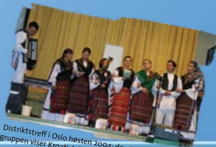
Distriktstreff i Oslo høsten 2004: den Kroatiske danse- gruppen viser Kroatisk folkedans.