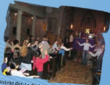
Distrikt Øst: La din barmhjertighet... Besøk i Hamar desember 2004.

I Asker og Bærum har de også nylig fått et nytt styre. Her er det en del ungdommer som driver med aktiviteter. De har blant annet arrangert hyttetur som var vellykket. De har vært aktive i adventsaksjonen. Så har de også hatt besøk av YFC.