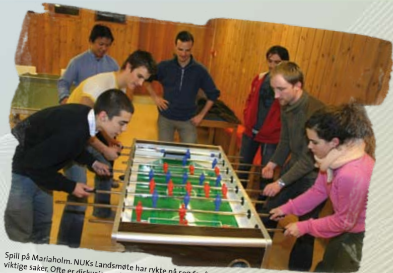
Spill på Mariaholm. NUKs Landsmøte har rykte på seg for å være et tungt møtet, med mange store og viktige saker. Ofte er diskusjonen livlig... Men nede i kjelleren er det garantert livlig!

fire dagene lærte vi en hel del om hvordan organisasjonen vår var bygget opp, og fikk nye ideer til å drive ungdomsarbeidet i våre egne menigheter. For å være helt sikre på at vi ikke sovna mellom innleggene hadde vi "Jonny, trykke på knapper" – leken, som fikk fram det gode humøret i oss alle.