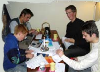
Ungdomslaget i Arendal har siden høsten 2004 blomstret opp igjen!

Likevel kan det mange steder være tungt å drive katolsk ungdomsarbeid. Tradisjonelle møter i ungdomslaget fenger ikke alle like mye. Derfor vokser det stadig nye idéer frem. Det siste året har det vært fokus på sportsarrangementer i flere lokallag, noe som har hjulpet disse med rekruttering