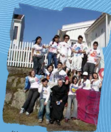
Forberedelser til Verdensungdomsdagene 2005 i distrikt Nord.