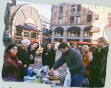
Fasteaksjonsdag i Oslo 19. februar 2005.

Parallelt med dette ble det forberedt deltakelse fra NUK i Caritas Norges Fasteaksjon våren 2005: "På lag med de fattige – sammen bygger vi Guds rike". Lørdag 19. februar lot det seg gjøre å arrangere en