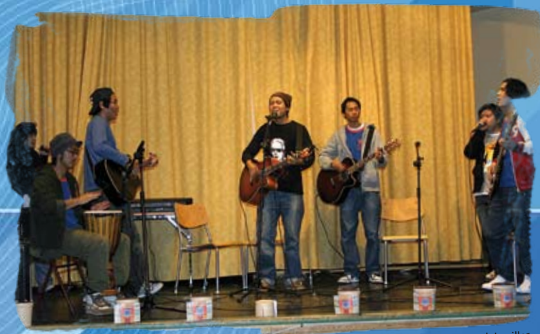
Distriktstreff i Oslo høsten 2004. YFC bandet spiller.