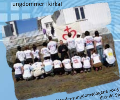
Forberedelser til Verdensungdomsdagene 2005 i distrikt Sør.

Blant andre aktiviteter ble det arrangert sportshelg i Kristiansand med et utrolig fremmøte av andre ungdomslag fra hele landet. Som ifjor og forfjor blir det også arrangert sommerbarneleir på Stella Maris, som denne gangen ble full. Vi har fått hele ni barn fra Larvik og flere fra Kragerø, Arendal og Kristiansand! Dette er svært gledelig for vårt distrikt. Ikke noe annet er mer positivt enn at barna blir kjent med hverandre på slike leirer – det skaper bånd og kommende ungdommer i kirka!