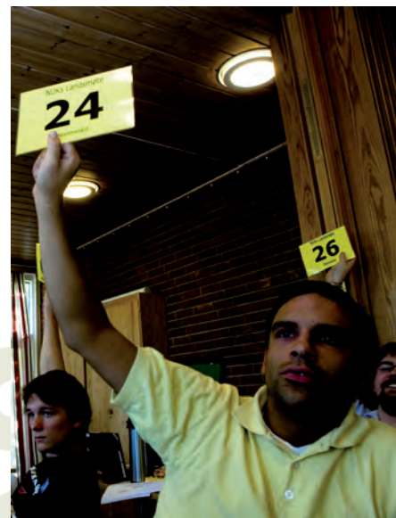
Landsmøtet 2009.

voksne. Som katolsk organisasjon hører NUK inn under biskopenes hyrdeansvar og følger deres avgjørelser i Norsk Katolsk Bisperåd i spørsmål som gjelder katolsk tro og moral. Organisasjonen er partipolitisk uavhengig.