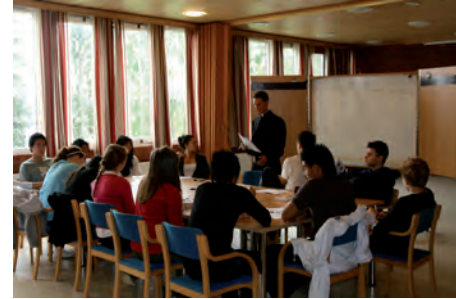
Fra ledertreningen.