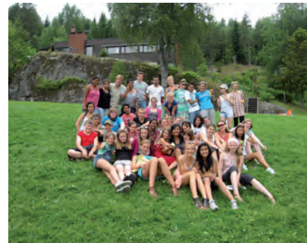
Juniorleir 2010.

Takker alle ledere og deltakere på årets juniorleir for en fantastisk fin uke!