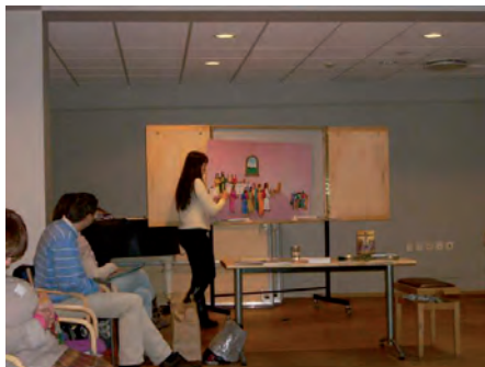
Barneutvalgets skoleseminar.

Barneutvalget fortsetter samarbeidet med Arken, og har i perioden hatt en fast dobbeltside i bladet hvor fokus har vært på de nye katolske barnebøkene fra St Olav forlag.