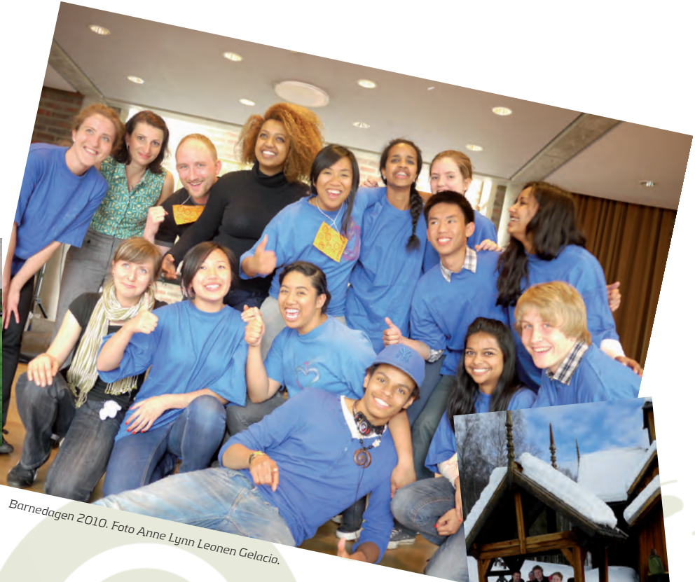
Barnedagen 2010.