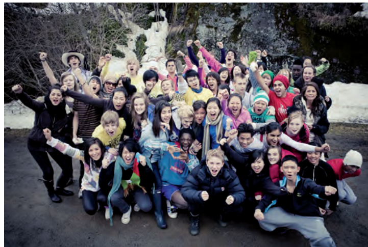
Påske + 2010.