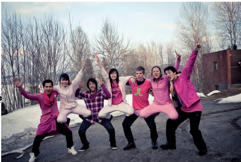
Påske + 2010.