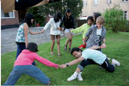
DRtreff ØST juni 2010.