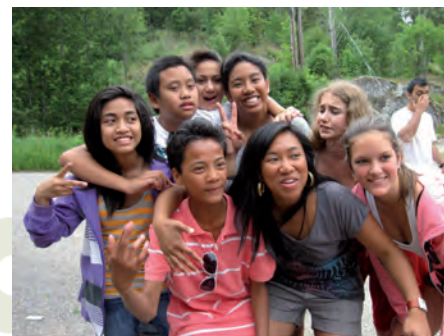
Juniorleir 2010.