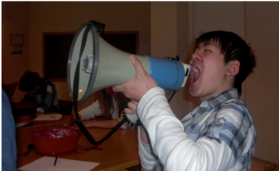
DR. Østfold Påskeleir Østfold 2010.