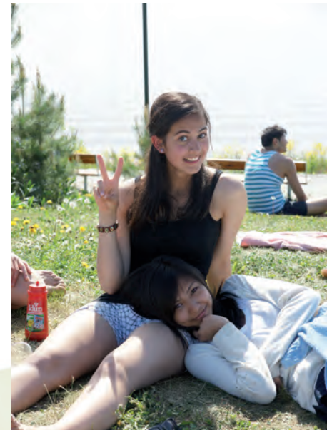
DRtreff ØST, juni 2010.