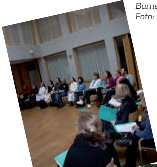
Barneutvalgets skoleseminar.