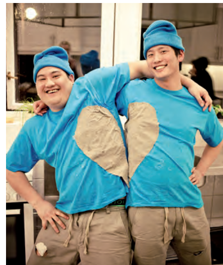
Påske + 2010.

Som en ekte påskeleir, inneholdt også denne leiren flere obligatoriske leirtradisjoner. Hver kveld ble det holdt trivia, hvor smarteste gruppe ble kåret, Mariaholm-kameratene opptrådte, fritiden var fylt av kortspilling og klimpring på gitar, og alle deltakere hadde hver sin hemmelige venn som de ga litt ekstra oppmerksomhet i løpet av uken. Siste dag på leir ble slageren P-OL arrangert, og grupper i alle regnbuens farger løp rundt og løste de merkeligste oppgaver. En vel gjennomført leir, det er vi alle enige i at det var, og vi gleder oss til neste år.