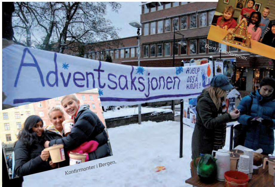
Stand på Hamar.

Som tradisjonen er i NUK var advent en tid der ungdom gikk ut på gatene, gikk med