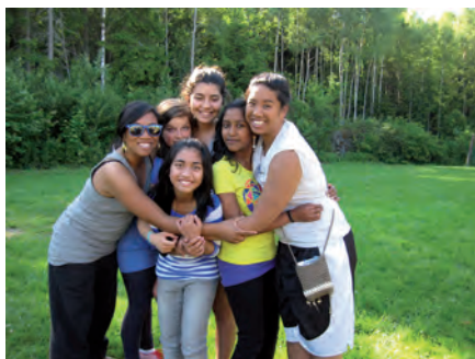
Juniorleir 2010.