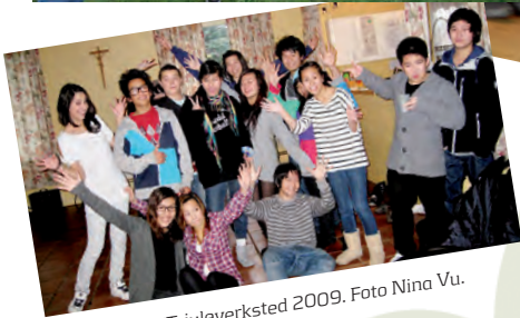
Kulip og AKUTT, juleverksted 2009.