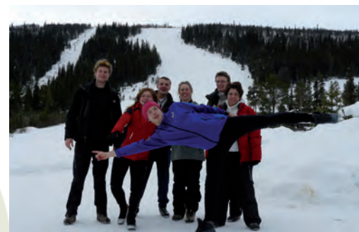
Skihelg mars 2010.