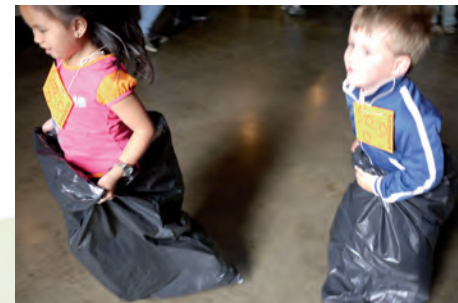
DR Oslo Barnedagen 2010.

24. oktober 09 hadde vi DISTRIKTSTREFF med temaet "Distrikt Oslo LEVER"! Vi feiret messe sammen og gikk deretter til St. Sunniva gymsal der det var liv, latter, underholdning og MASSE MAT! Ikke bare var det 1 lokallag, ikke bare 15 personer, men ihvertfall 150 ungdommer var samlet fra de ulike lokallagene og beviste at OSLO lever! ... og at Herren lever i oss!