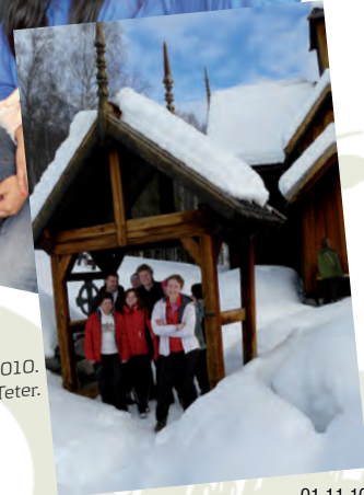
Skihelig mars 2010.